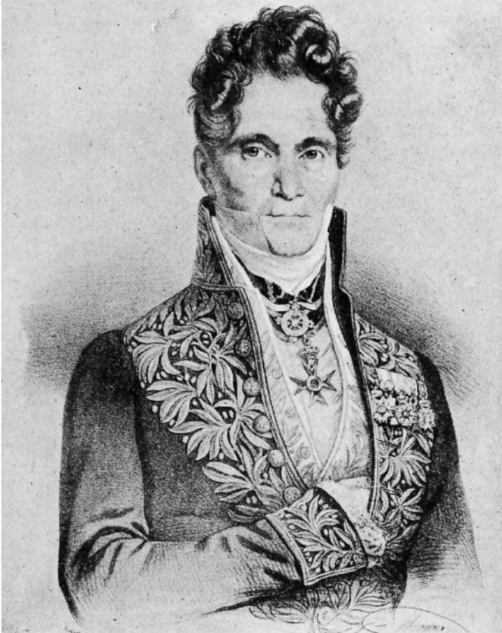
Portrait de Spontini vers 1815. Conservatoire de Genève.

The action ends with a tableau of the entire company.)