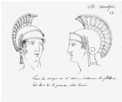
Casque pour M. Montjoie.

(All leave. The Priests surround Cassander and the Soldiers follow him.)