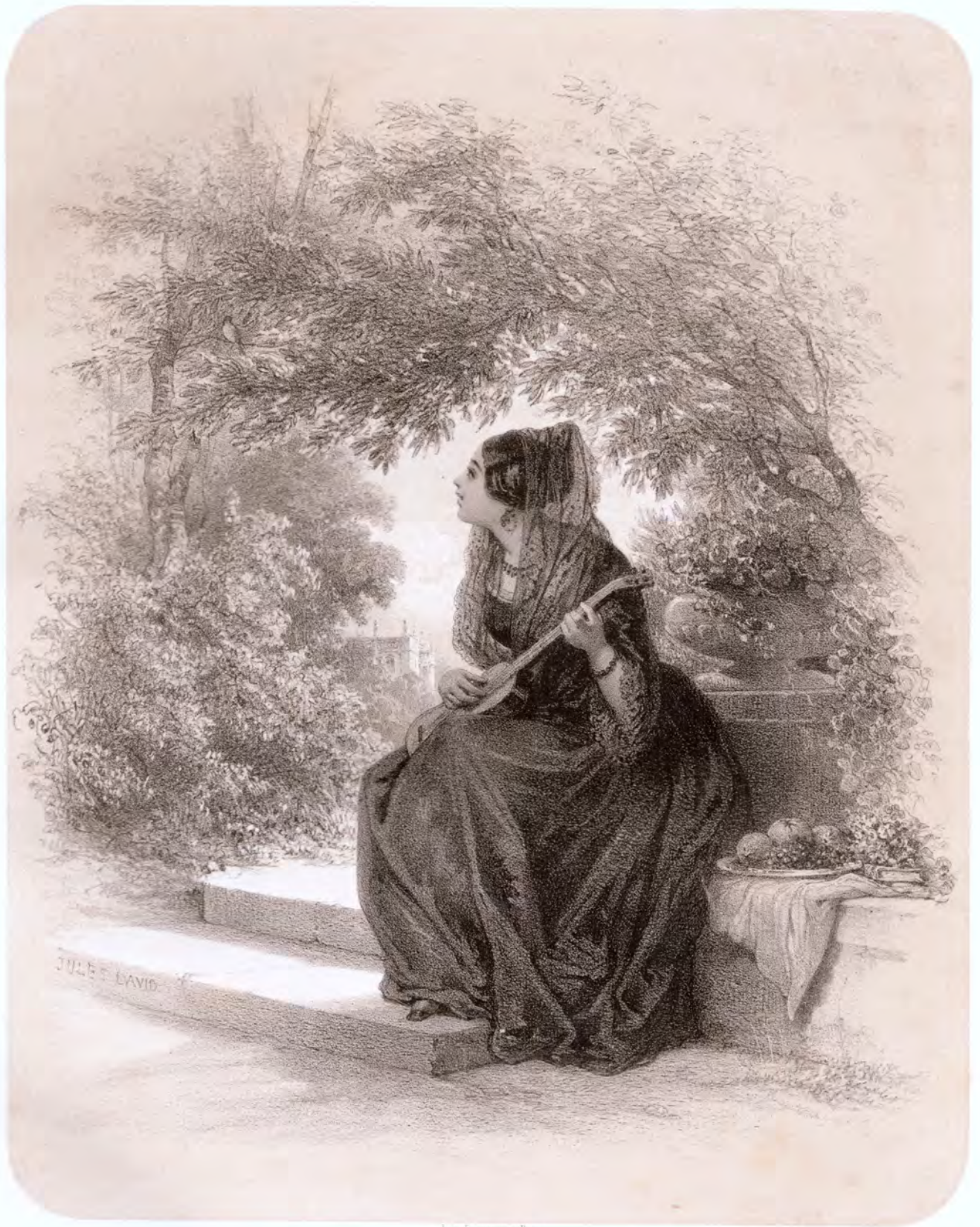
Imp. Leconte, Paris