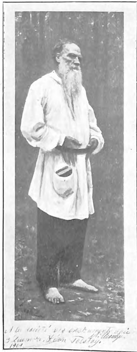
et la sainte vie chrétienne après 3 jours, Léon Tolstoï. 1904