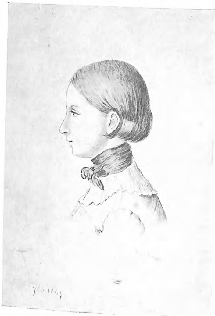
CAMILLE SAINT-SAËNS à l'âge de 9 ans