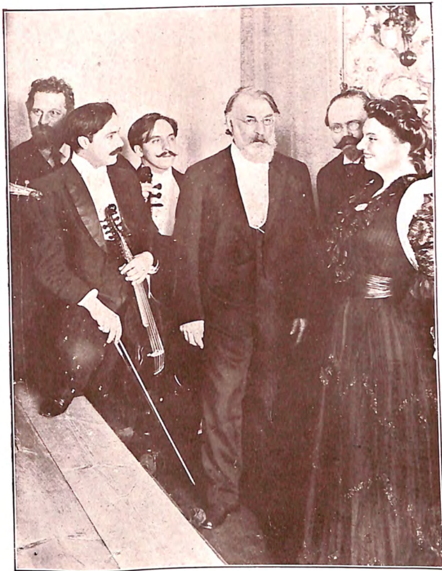
M. H. CASADESUS M. Joseph JOACHIM M. HUMPERDINK M. M. CASADESUS (1904) M me Yvette GUILBERT