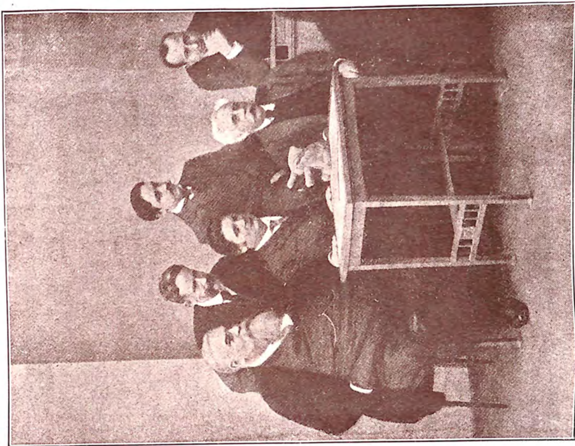
M. BRANDOUKOW M. H. CASADESUS M. ZILOTI M. R. PUGNO M. E. YSAYE M. G. FAURÉ

Photographie prise à Moscou en 1910, à l'issue d'un Concert au Conservatoire, où la Société des Instruments Anciens, Pugno, Ysaye, Brandoukoff, Gabriel Fauré et Ziloti, avaient pris part.